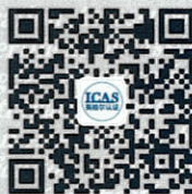
Focus on icas WeChat platform